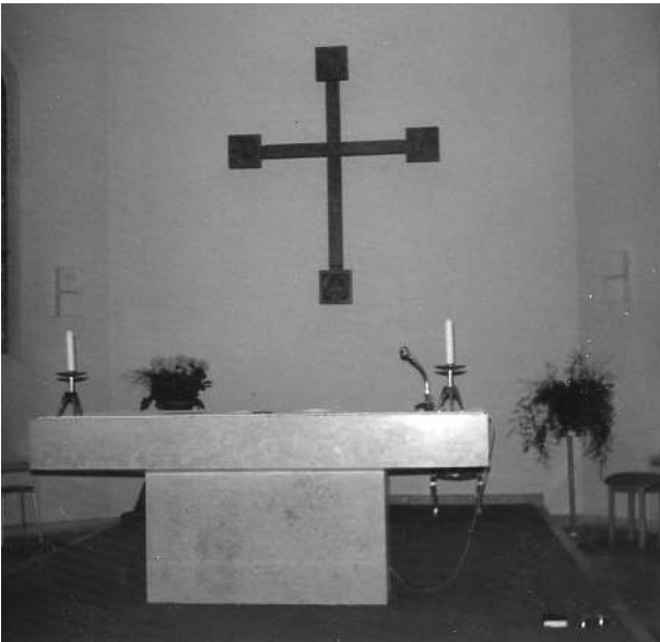
Altar mit Stufe nach Umbau