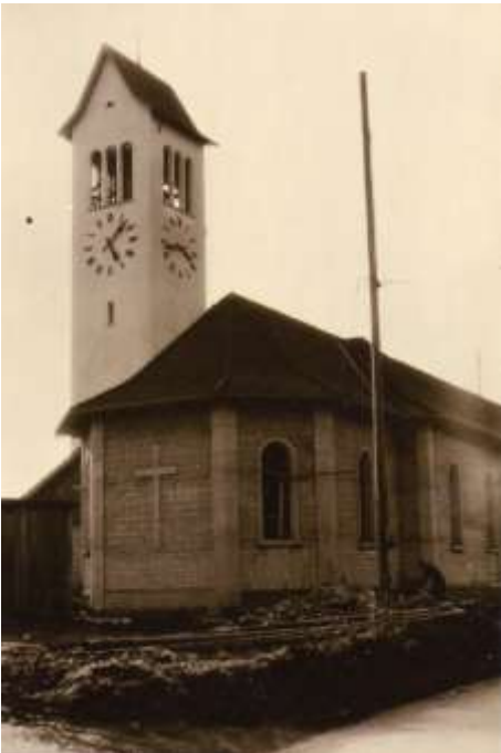
Kurz vor der Fertigstellung