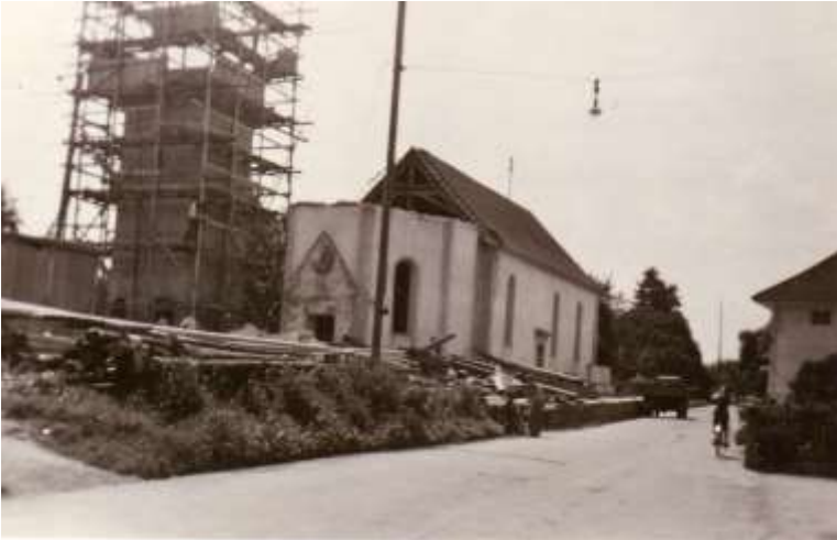
Turm im Bau, vor dem Abbruch des alten Chorraumes